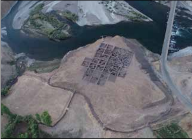
Fotoğraf 1: Murat Nehri kenarında yer alan Murat Höyük kazısının havadan görünümü / Aerial view of the Murat Höyük excavation located near the Murat River

Kalehan Genç Enerji Üretim A.Ş. tarafından yapılan Aşağı Kaleköy Barajı ve HES kapasite artırımı projesi kapsamında 2019 yılında kurtarma kazılarına başlanılmış ve aynı yıl içerisinde tamamlanmıştır. 2018 yılında Murat (Norik2) Höyük olarak tescillenen ve ismini içinde bulunduğu köyden alan yerleşme, denizden +1088 m yükseklikte, kuzeybatı-güneydoğu uzantılı 140 x 120 m büyüklüğünde ve 15 m yükseklikte dikdörtgen formlu olup, doğal bir tepenin üzerine kurulmuştur (Foto. 1).