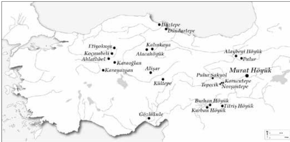
Harita 1: Erken Tunç Çağı'nda Murat Höyük konumu ve metinde adı geçen pişmiş toprak figürin karşılaştırması yapılan yerleşimler (Çizim: Abdulkadir Özdemir) / Map of Anatolia showing Murat Höyük in Early Bronze Age and other prehistoric sites mentioned in the text (Drawing: Abdulkadir Özdemir)

Murat Höyük IV kültür katı, bu çalışmaya konu olan pişmiş toprak antropomorfik figürinlerin ele geçtiği Erken Tunç Çağı'na aittir. IV. kültür katı, höyüğün güney ve güneydoğu kısmındaki nehre en yakın alanda görülmektedir. Bu kültür katında dikdörtgen planlı ve tek odalı taş temel üzerinde kerpiç mimarinin olduğu ve bunun da ağır bir yangınla son bulduğu görülür. Temel sıraları tek veya çift sıra taştan kuru duvar tekniğinde örülmüş ve tabanları sıkıştırılmış sert toprak taban ile oluşturulmuştur.