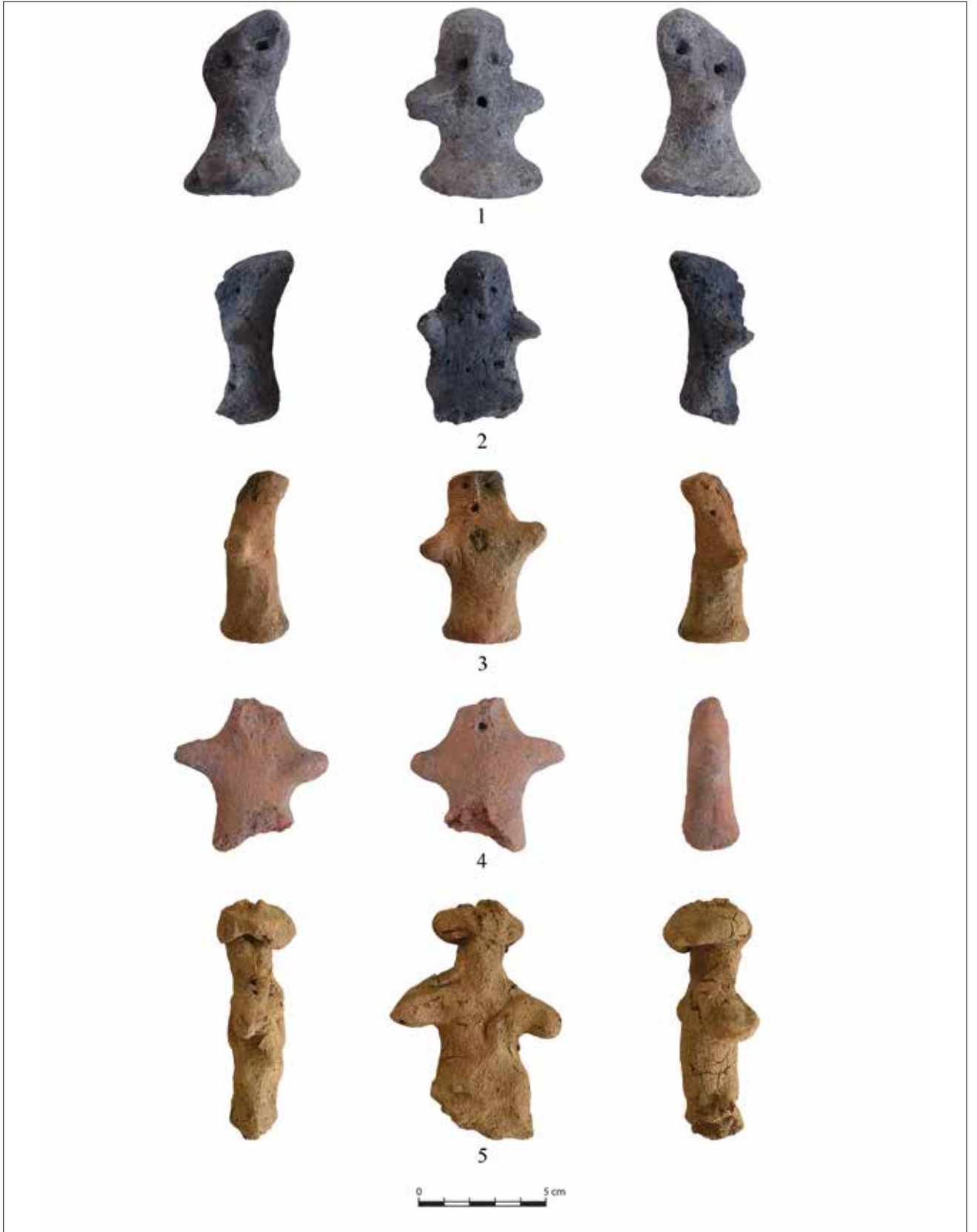
Fotoğraf 3: Murat Höyük IV, Pişmiş Toprak 1,2,3,4 ve 5 No'lu Antropomorfik Figürinler / The Terracotta Figurines 1,2,3,4 and 5 of Murat Höyük, at level IV